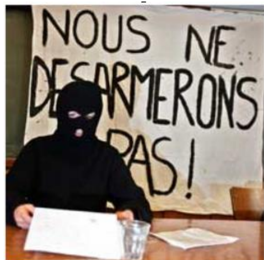
A l'université de Rennes

Ne vous méprenez pas. Si le protagoniste présent sur la photo porte une cagoule, c'est qu'il fait très froid dans le local où le cliché a été pris.